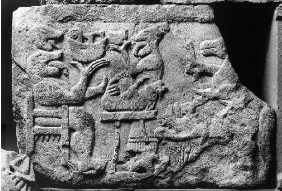
Fig.5: Relieve del banquete del conjunto monumental de Pozo Moro. Fuente: LÓPEZ PARDO, “Nergal y la deidad del friso...”, p. 32.

ría en tal caso la provincia de Albacete, en la que encontramos las primeras “evidencias” de banquete funerario ibérico, y en la que comprobamos que todavía existe el recuerdo (al menos en un plano mitológico, pero en todo caso presente en el imaginario colectivo) de los antiguos banquetes orientales relacionados con el mundo de la ultratumba, tal y como se pone de manifiesto en el conocido relieve de Pozo Moro 114 . De hecho, en relación con éste último merece la pena recordar la cercanía (física y, según la interpretación de sus excavadores, cronológica) entre dicho relieve, en el que se representa un banquete de tipo oriental, y el ajuar del servicio del vino con iconografía simpótica que se encontraba a sus pies 115 , o mejor aún, los restos faunísticos con marcas de consumo humano documentados alrededor y que nos estarían hablando, de ser correcta su interpretación y datación, de la realización de banquetes funerarios en la propia necrópolis.