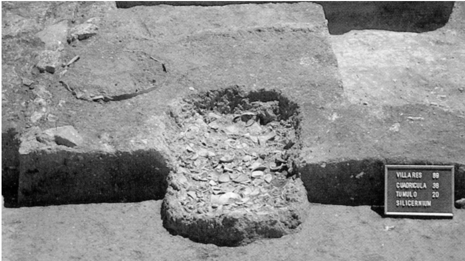
Fig.1: “Silicernium” bajo el túmulo 20 de la necrópolis de Los Villares.

pretativa del registro funerario ibérico se generalizó. Inmediatamente fueron localizados otros posibles silicernia en necrópolis excavadas anteriormente, y los restos faunísticos que aparecen en todas las necrópolis ibéricas y que hasta entonces apenas habían suscitado la atención de los arqueólogos se convirtieron en una nueva fuente de información arqueológica. La cuestión no es baladí: tanto el silicernium de El Molar como los de Los Villares datan en torno al 400 a.C., y si se acepta su interpretación como tales, se convertirían en la prueba más evidente para constatar la aparición en el sureste peninsular de una aristocracia que acaba de desplazar en estas fechas a la anterior estructura monárquica.