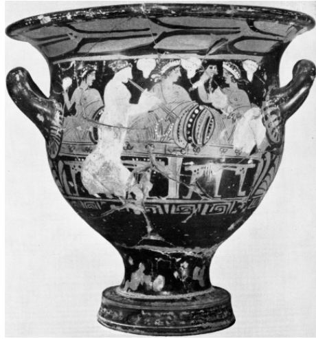
Fig.3: Escena simpótica en una crátera hallada en la necrópolis de Cerro del Real (Tútugi).

sátiro que aparece en un cuenco de figuras negras documentado en el castillo de Fuengirola, y datado en el tercer cuarto de la misma centuria 50 , y tan sólo algunas décadas después destacará el sátiro del lekythos del ajuar hallado bajo el monumento de Pozo Moro 51 , del que acabamos de hablar en relación con otra de sus piezas. A comienzos del siglo IV a.C. nos encontramos con otra imagen de sátiro que merece la pena destacar, pues aparece en la crátera de El Salobral que ya hemos mencionado páginas atrás como el primer vaso de este tipo que aparece en tierras del interior peninsular 52 . Por mencionar sólo dos ejemplos más, podemos destacar también un escarabeo y una terracota aparecidos en Ibiza, en los que aparecen un sátiro olisqueando un ánfora y otro que ha sido representado itifálico y danzante 53 .