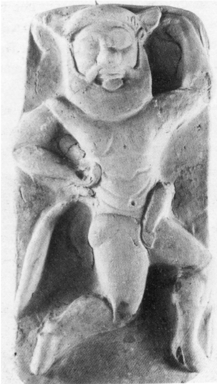
Fig.4: Sátiro en placa de terracota de Ibiza.

Como se puede comprobar, la iconografía griega referente al ambiente del symposion que llega a la Península Ibérica es ingente 55 . Junto con ella y con la vajilla griega, algunos autores piensan que arribaría al mundo ibérico la ideología propia del simposio aristocrático griego 56 , lo que en ocasiones se ha utilizado como otra evidencia más para probar la existencia del banquete funerario ibérico 57 . En nuestra opinión, sin embargo, la relación de todas estas piezas tampoco constituye un argumento sólido en soporte de la supuesta historicidad del banquete funerario. En primer lugar, porque symposion y banquete funerario son dos comportamientos rituales muy diferentes, tal y como comentaremos más adelante. Pero en segundo lugar, y en ello es en lo que nos detendremos por el momento, porque no podemos dar por sentado que los iberos aprehendieron la ideología griega del symposion y la hicieron suya junto con los vasos y las representaciones iconográficas que importaron. Por supuesto, siempre es esperable un cierto grado de reinterpretación, y ello