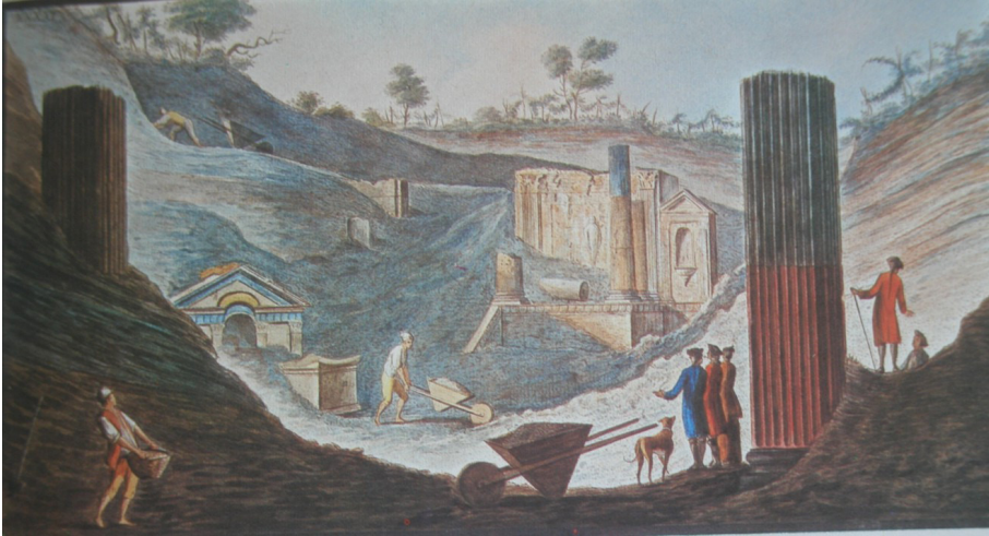
Figura 2. Dibujo de Pietro Fabri incluido por Sir William Hamilton en Campi Phlegrei , Pl. XLI, Nápoles, 1776.

El templo de Isis comenzó a excavar el 9 de febrero de 1765 6 , aunque no supieron que se trataba de un santuario dedicado a la diosa egipcia hasta el 20 de julio, cuando salió a la luz la inscripción dedicada por Celsino. Un dibujo de Pietro Fabri, incluido por Sir William Hamilton en Campi Phlegrei 7 , nos muestra el desarrollo de las excavaciones ante la atenta mirada de varios caballeros que habrían acudido hasta el lugar para conocer de primera mano los progresos (Figura 2).