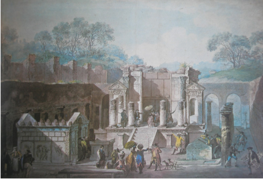
Figura 3. F. Piranesi y J.L. Desprez, Visitantes en el templo de Isis, 1778-1779.

Sin duda alguna el que mejor supo manipular todos estos elementos fue Bulwer Lytton en su famosísima novela Los últimos días de Pompeya publicada en 1834. Ningún otro libro (ni histórico ni de ficción) ha influido tanto en la imagen que popularmente se ha tenido, no sólo de la ciudad sepultada por el Vesubio, sino también de las costumbres de sus habitantes 13 .