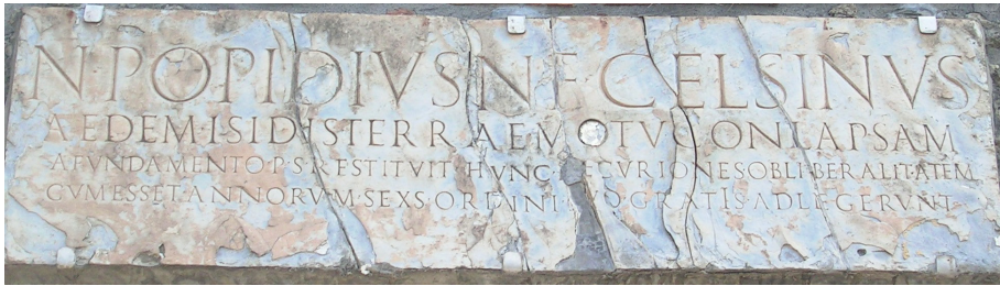
Figura 1. Inscripción del Templo de Isis donde se indica quién ha costeado las obras de restauración tras el terremoto.