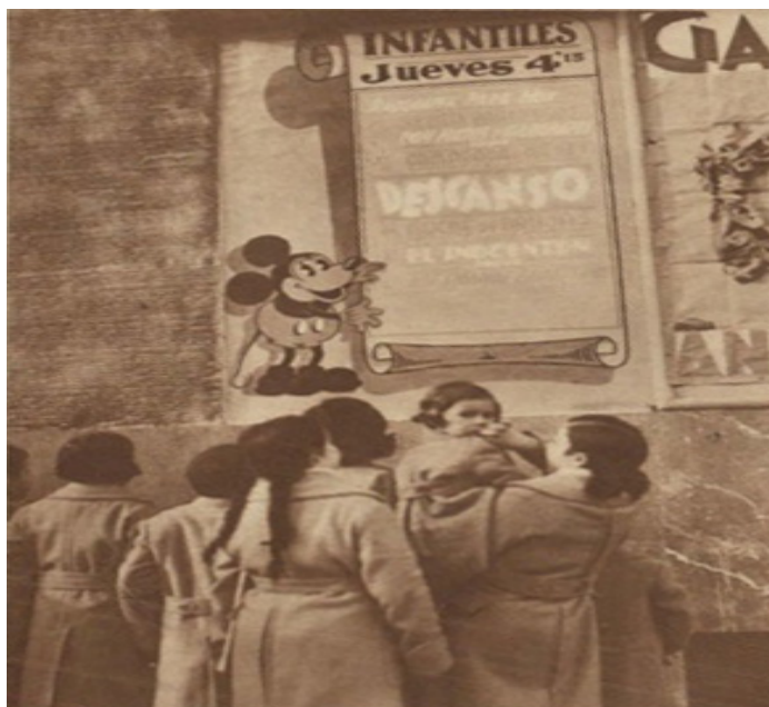
Imagen nº3. – Fotografía de un “jueves infantil”.

En los meses previos a la Guerra Civil, encontramos una gran oferta de filmes de animación en los cines de Madrid, bien como complementos de los largometrajes de Hollywood o bien proyectados en las ya citadas “jornadas infantiles”. Durante los meses previos al conflicto, estas sesiones de los jueves por la tarde eran muy populares, cuando además de ver una película cómica de Charles Chaplin, Oliver y Hardy o La Pandilla, también se proyectaban dibujos animados en los que aparecían personajes como Mickey Mouse, Pluto, Pato Donald, La Vaca Clarabella, El Caballo Horacio o Minnie Mouse, por parte de Walt Disney, o Popeye y Betty Boop, de Fleischer Studios 60 y como ya se indicó, terminaban con un sorteo de juguetes entre el público. En ocasiones, el público lo formaban alumnos de las escuelas municipales y los establecimientos benéficos 61 . Igualmente, continuaban en boga las “Semanas Walt Disney”, así como las “Semanas de Betty Boop” o “Semanas Paramount”. Como dato anecdótico, cabe añadir que llegaron a realizarse proyecciones 3D, como la organizada por el cine Actualidades en abril de 1936 62 .