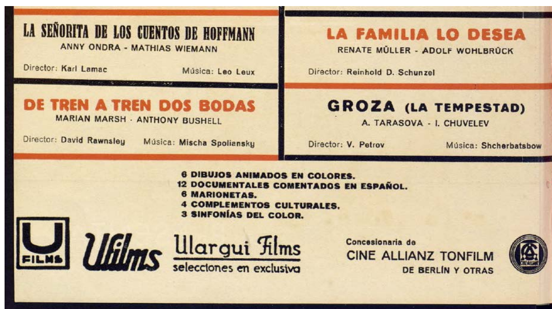
Imagen nº2. – Fragmento de anuncio publicitario de la distribuidora Ufilms