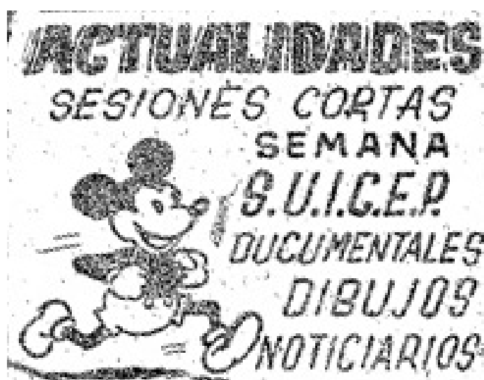
Imagen nº4. – Publicidad del cine Actualidades anunciando proyecciones del sindicato anarquista SUICEP, junto a un dibujo de Mickey Mouse