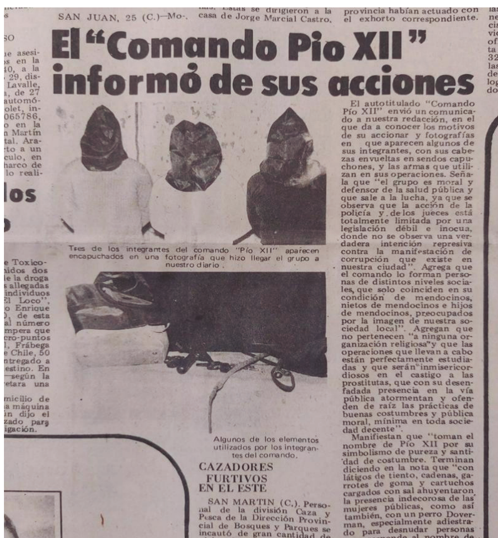
Diario Mendoza, 26 de julio de 1975

La persecución de prostitutas ilumina varias cuestiones. En primer lugar, de qué modo la dimensión de género actuó en la trama represiva y cómo las violencias estructurales se articularon con las coyunturales. Si bien los castigo hacia mujeres y cuerpos feminizados por parte de las policías no fueron una novedad, se acrecentaron notablemente y el modus operandi adquirió formas desconocidas tales como: golpizas con palos y cadenas en la vía pública por parte de encapuchados, rapado de mujeres y realización de marcas infamantes en sus cuerpos, abandono de cadáveres calcinados en lugares utilizados por la violencia paraestatal como depósito de cuerpos, colocación de bombas en cabarets y razzias policiales masivas que derivaban en la detención de prostitutas alojadas en el Centro Clandestino de Detención (CCD) D2 (Departamento de Informaciones) lugar en el que eran sometidas a abusos y torturas.