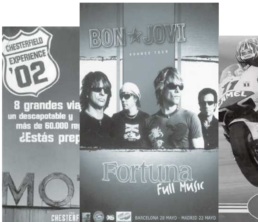
Gráfico 2. Publicidad dirigida más específicamente hacia el sector adolescente.

Para mantener su negocio el mercado del tabaco necesita captar cada día 480 nuevos clientes entre niños y niñas y adolescentes españoles. Para sustituir a las personas que dejan de fumar y a las que mueren prematuramente por su causa en España, la industria necesita reclutar más de 175.000 nuevos fumadores para asegurarse sus beneficios actuales.