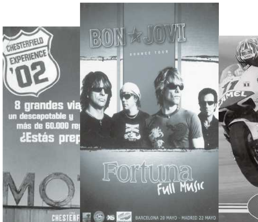
Gráfico 2. Publicidad dirigida más específicamente hacia el sector adolescente.

Para mantener su negocio el mercado del tabaco necesita captar cada día 480 nuevos clientes entre niños y niñas y adolescentes españoles. Para sustituir a las personas que dejan de fumar y a las que mueren prematuramente por su causa en España, la industria necesita reclutar más de 175.000 nuevos fumadores para asegurarse sus beneficios actuales.