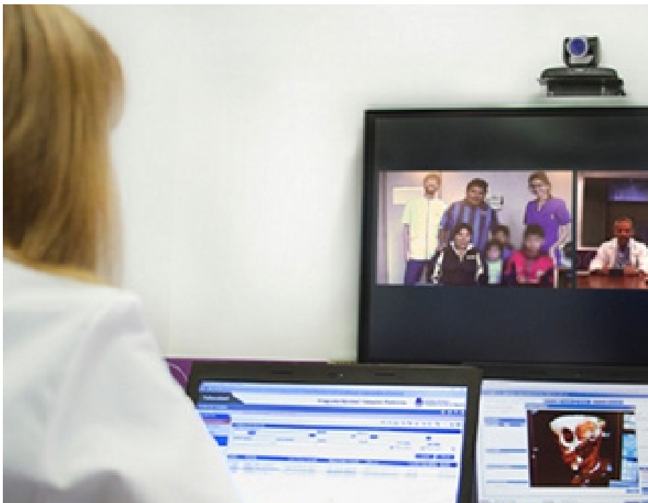
Figura 3: Consultorio virtual OCD/Telemedicina Garrahan.

la red de OCDs con un entorno web especialmente diseñado para tal fin bajo estándares internacionales de confidencialidad y protección de datos que es la “Plataforma de Telesalud” y que se encuentra en permanente evolución de acuerdo a las diversas necesidades.