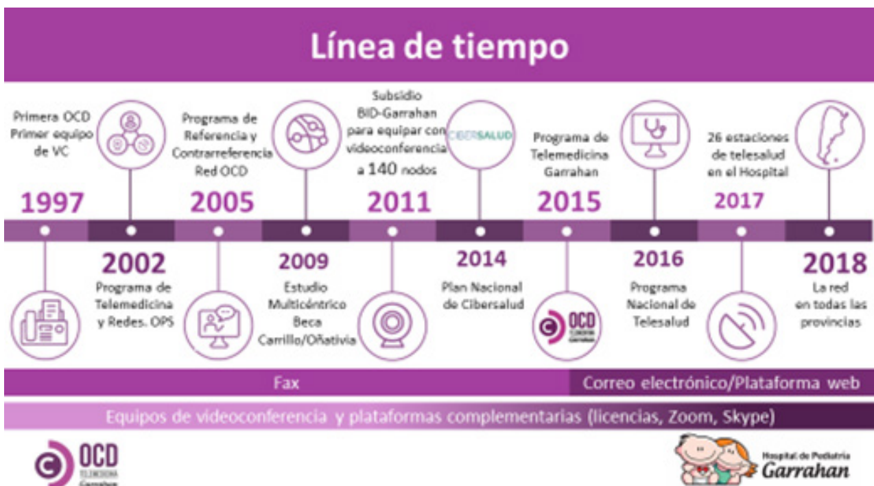
Figura 1: Línea de tiempo histórica de OCD/Telemedicina Hospital Garrahan. Elaboración equipo OCD.

En la concepción de la OCD la comunicación ha dejado de ser un ‘instrumento al servicio de’, para convertirse en una dimensión estratégica en el campo de la salud. Es el espacio común donde las interacciones humanas posibilitan permanentemente nuevos sentidos, desafíos y oportunidades de mejora para la atención de la salud de la comunidad.