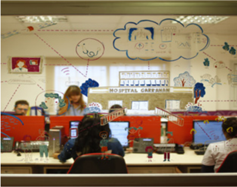
Figura2: OCD/Telemedicina Hospital Garrahan