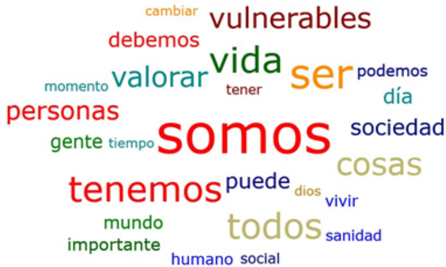
Figura 2. Palabras más utilizadas por los encuestados ante la pregunta “¿Qué conclusiones sacas de esta enfermedad?”. (Figura generada con Atlas.ti 8).