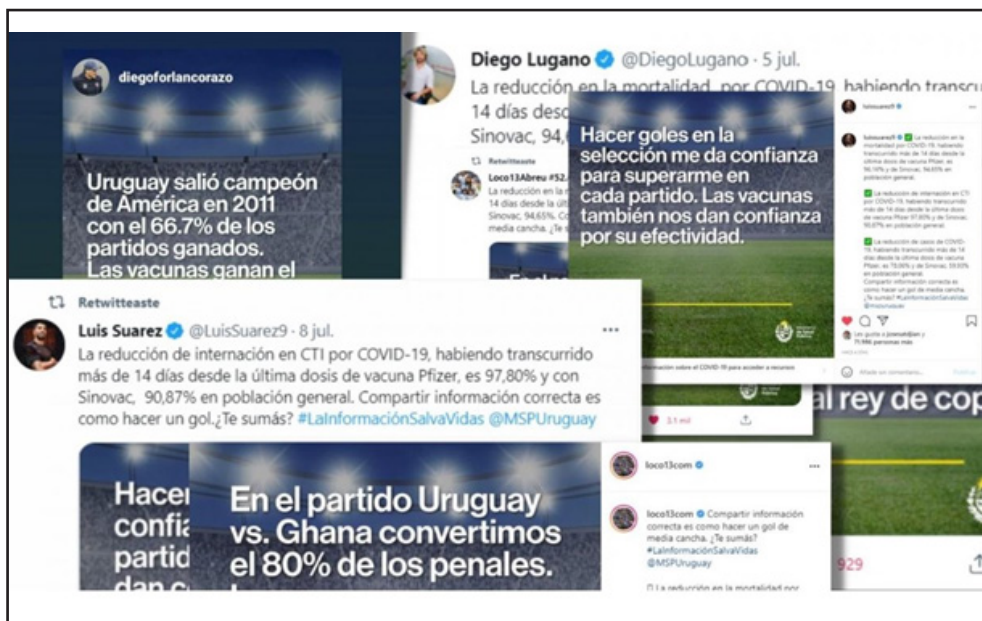
Figura 1. Campaña en redes sociales con futbolistas uruguayos como influencers.

predispuesta a vacunarse contra la covid-19, pero en la medida en que la población accedía a la información y confiaba, cambiaba su actitud frente a las vacunas. Cuando en marzo llegaron las primeras dosis de Sinovac y se inició la inoculación, el 81% de la población estaba predispuesta a vacunarse, según las cifras de Equipos Consultores (gráfico 2).