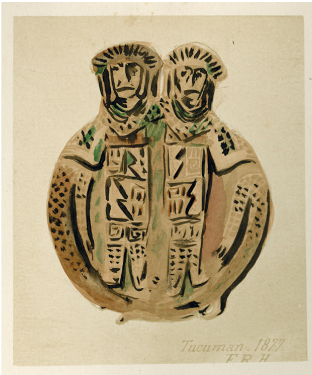
Figura 3: Ilustración del libro Liberani y Hernández (1950 [1877]). Biblioteca Nacional.